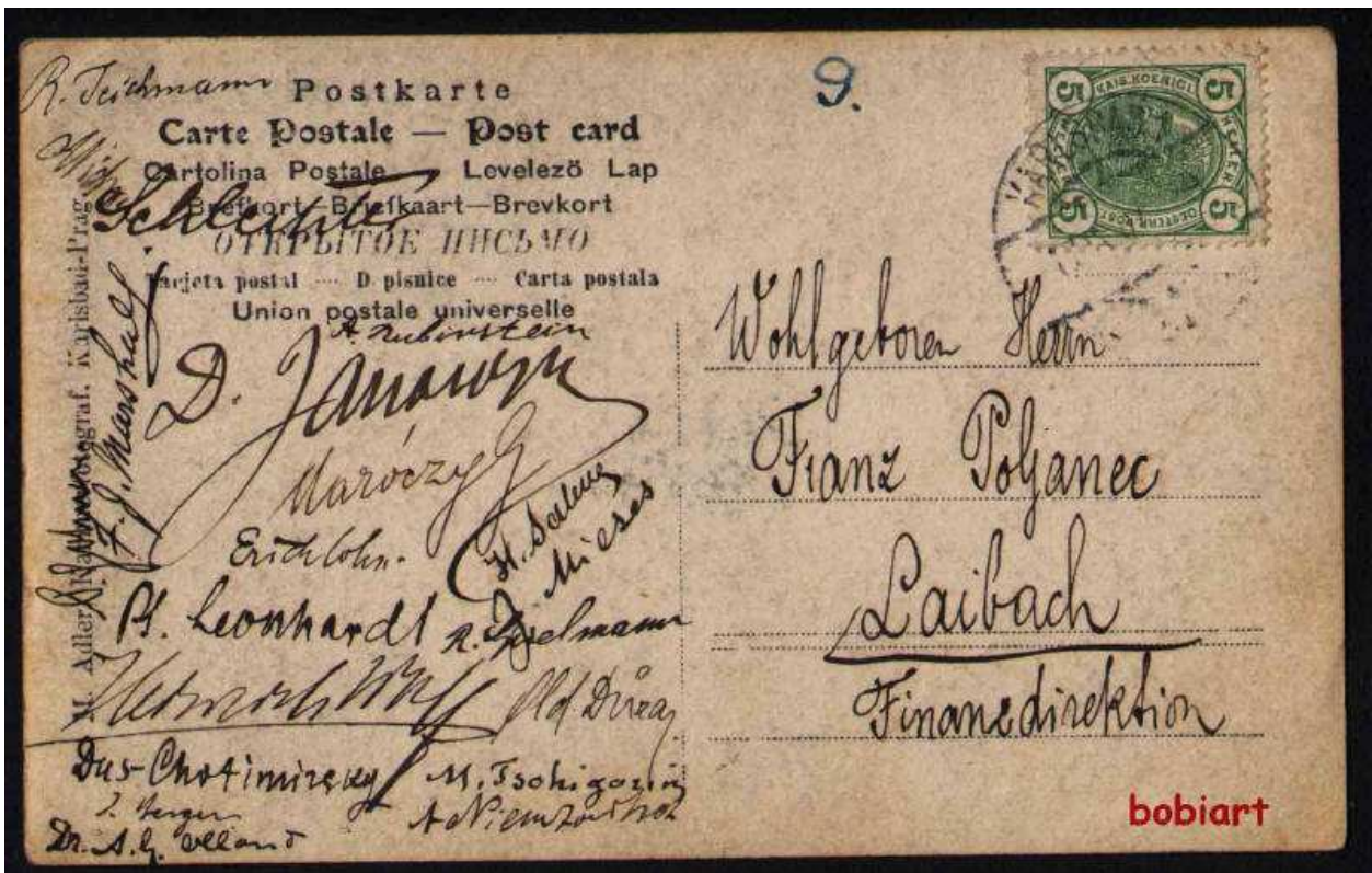
En op diezelfde veiling ook nog deze van hetzelfde toernooi in Karlsbad 1911: Ook hier is de voorzijde gedeeltelijk weergegeven.